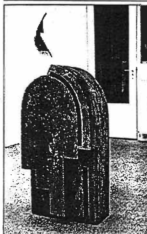
Ron van de Ven, Zonder titel, (bewaarpplaats)